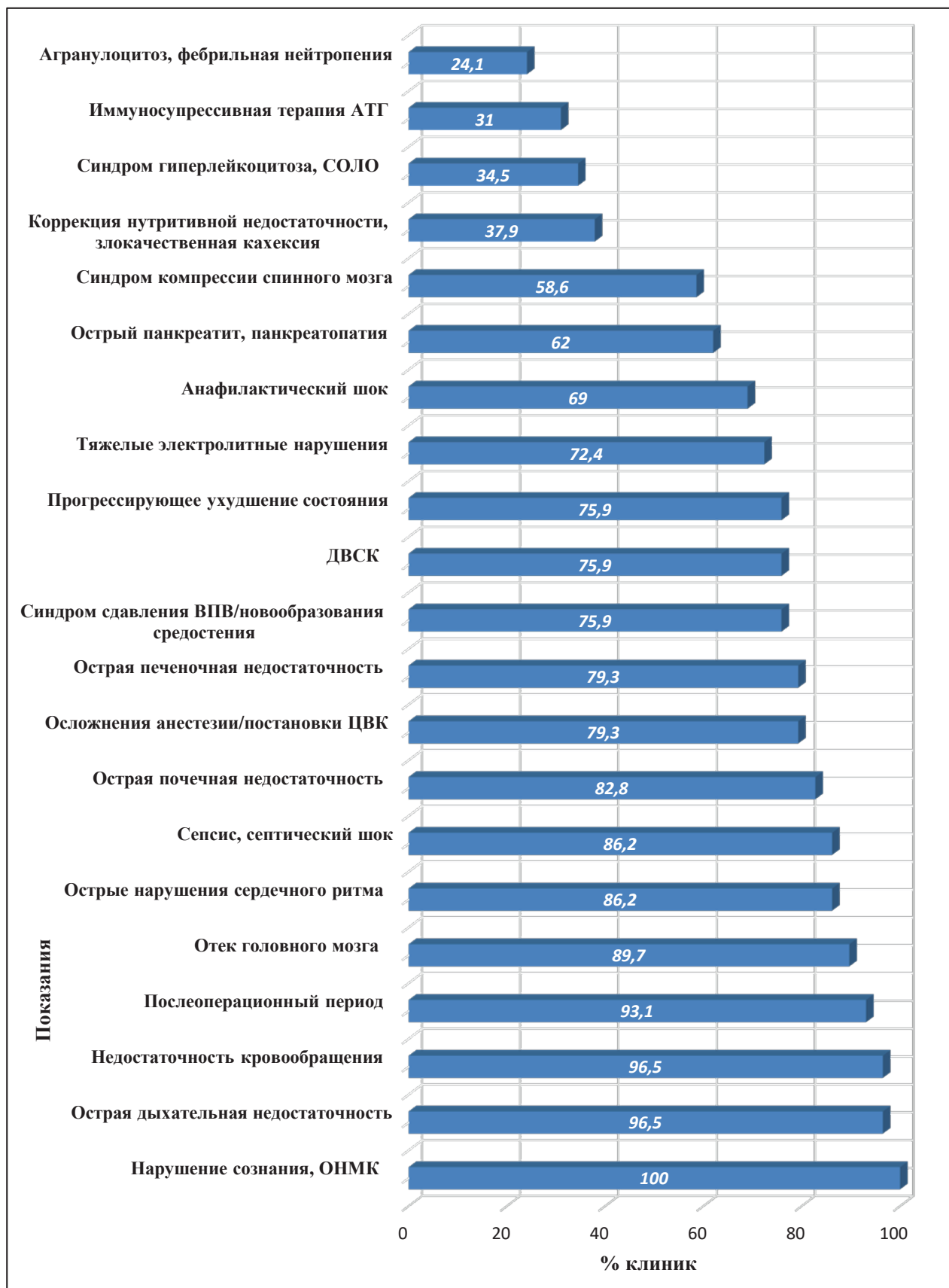
Рис. 3. Показания для перевода пациентов в ОРИТ (СОЛО – синдром острого лизиса опухоли, ВПВ – верхняя полая вена)