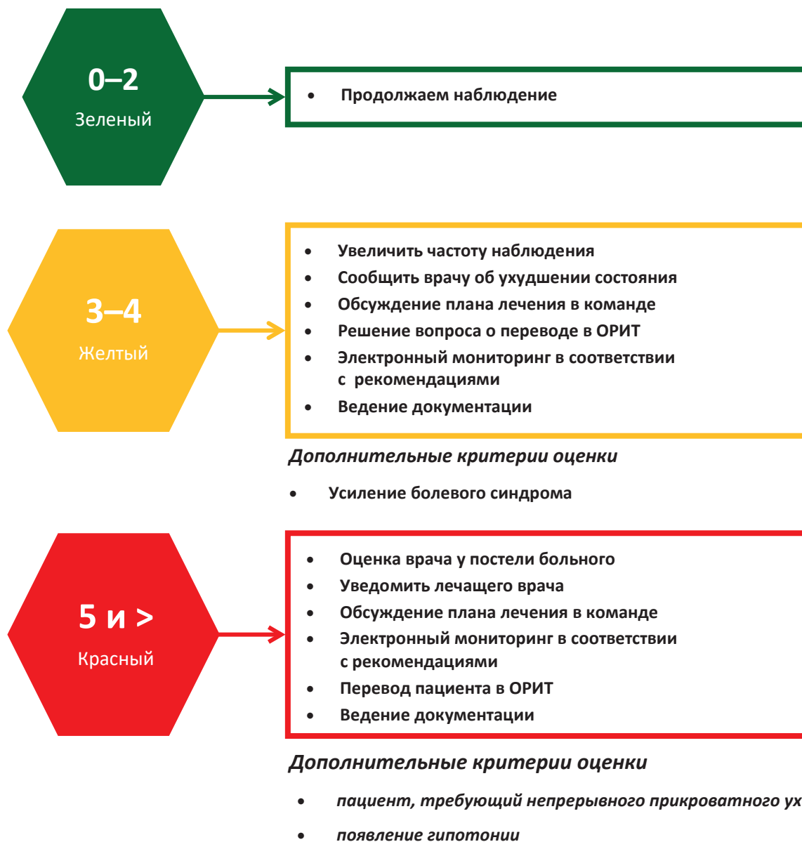
Рис. 2. Алгоритм действий медицинского персонала при ухудшении состояния ребенка